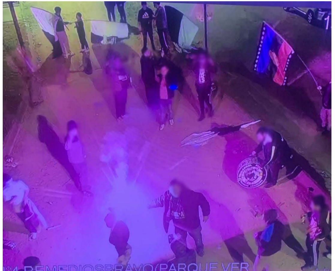
Finalmente Fernández junto con el equipo de la avenida O'Higgins esquina con Andrés Bello y Seguridad Pública, interceptaron el vehículo en detuvieron al sujeto.

“El personal de la Central Cámaras —detalle— procedió a entregar información a los funcionarios de Carabineros de Chile quienes se trasladaron hasta el lugar y por medio de la información entregada en tiempo real por parte de los operadores de las Cámaras lograron realizar el seguimiento del individuo mientras hacía abandono del parque en un vehículo”.