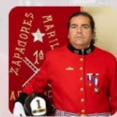
DIRECTOR Rudy Ruff