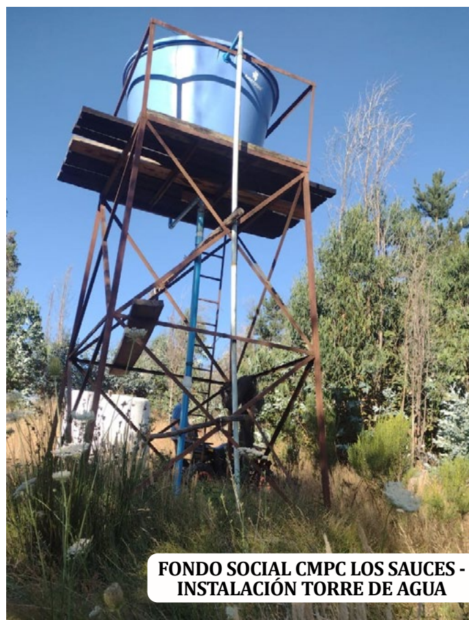
FONDO SOCIAL CMPC LOS SAUCES - INSTALACIÓN TORRE DE AGUA

Por último, Renaico también celebró la adjudicación de otros 9 proyectos.