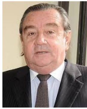
Cristián Labbé Galilea

Con un desparpajo que no deja de llamar la atención, buscó emocionar a la Asamblea señalando: “traigo la experiencia de mi país para liderar con esperanza...”. Sin embargo, poco se condice esa afirmación con la huella de su gobierno, marcada por una fuerte polarización y por una caída en las expectativas de crecimiento, desarrollo y bienestar social. Si alguna experiencia dejó su gestión... fue la de fracaso.