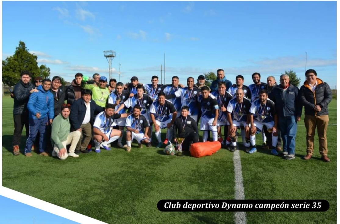
Club deportivo Dynamo campeón serie 35

Con motivo del aniversario de la ciudad de Victoria, se desarrolló un campeonato de fútbol seniors que reunió a equipos de distintas categorías y en la instancia final contó con la presencia de autoridades locales y regionales.