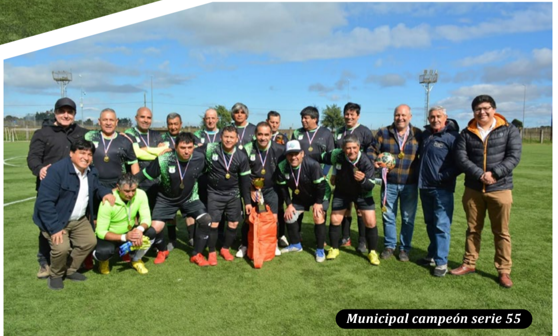
Municipal campeón serie 55

El campeonato aniversario no solo fortaleció la tradición futbolística de Victoria, sino que también se consolidó como un espacio de encuentro comunitario, donde deporte, identidad local y celebración se unieron en torno a la pasión por el fútbol.