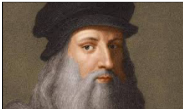
Leonardo Da Vinci (1452-1519).

* Micropene. Inferior a 7,1 centímetros.