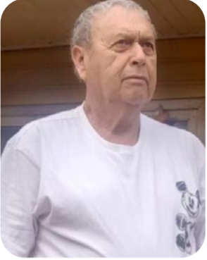
con el compromiso de seguir fortaleciendo el deporte senior en nuestra comunidad.

Con motivo del aniversario de la ciudad de Victoria, se desarrolló un campeonato de fútbol seniors que reunió a equipos de distintas categorías y en la instancia final contó con la presencia de autoridades locales y regionales.