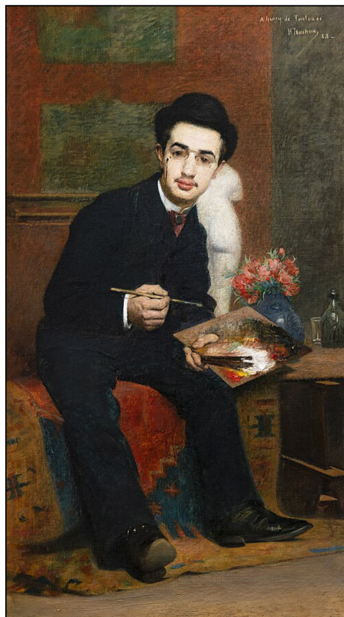
Toulouse-Lautrec, un enano superdotado sexualmente.

baratando un mito. El tamaño del pene tiene menos ligazón con la estatura que otros órganos. Aun cuando no hay correlación entre la medida y el goce que pueda propiciar a su compañera, pues la parte del placer de la mujer se origina en el clítoris y en los primeros cinco centímetros de la vagina.***