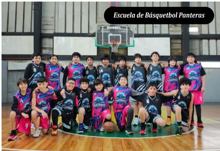
Escuela de Básquetbol Panteras