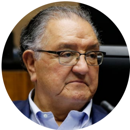
Francisco Huenchumilla Jaramillo, Senador