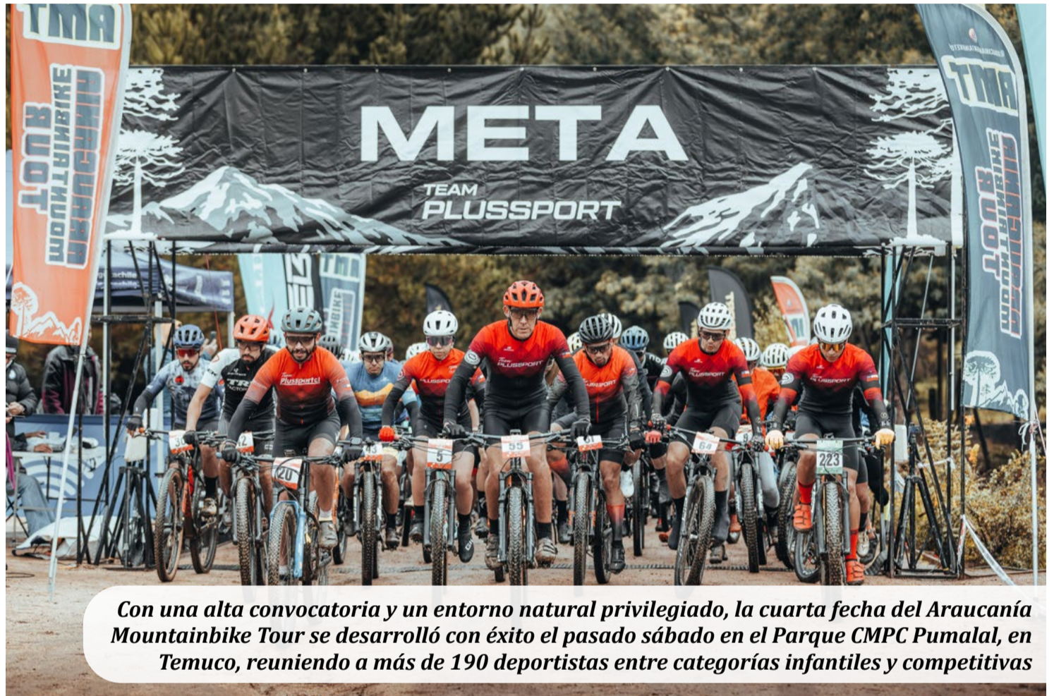
Con una alta convocatoria y un entorno natural privilegiado, la cuarta fecha del Araucanía Mountainbike Tour se desarrolló con éxito el pasado sábado en el Parque CMPC Pumalal, en Temuco, reuniendo a más de 190 deportistas entre categorías infantiles y competitivas

Se habilitaron recorridos con distintos niveles de dificultad, junto a dinámicas recreativas como pruebas tipo