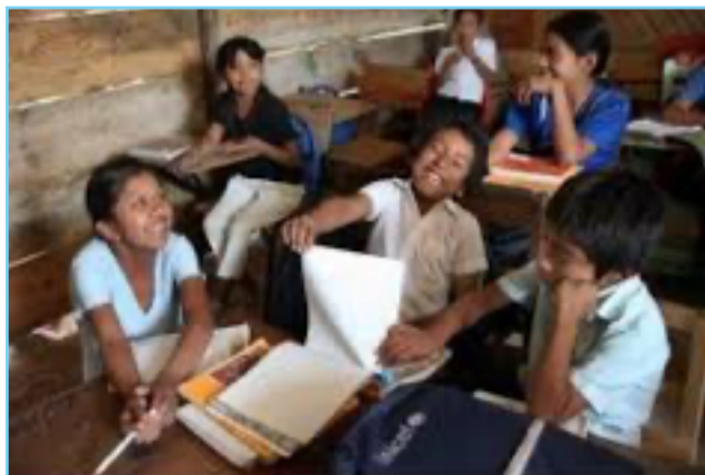
La baja inversión en educación ha sido uno de los factores del retraso en América Latina.

Sin embargo, ni las razones históricas ni la herencia colonial explican por sí solas por qué la mitad de la economía escapa a la burocracia.