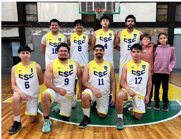
C.D. Colegio Santa Cruz.

Un acierto resultó el inicio del Campeonato de Básquetbol Adulto Varones en su dimensión laboral y que es organizado por la Oficina de Deportes de nuestra ciudad. Después de algunos torneos locales e interciudades, organizados por las Escuelas de Básquetbol Pepali y Panteras, tanto en el aspecto formativo como competitivo por varios años, volvió a moverse la naranja en el rectángulo del Gimnasio Bernardo Muñoz Vargas, para dar vida a un torneo que reúne a seis instituciones victorienses.