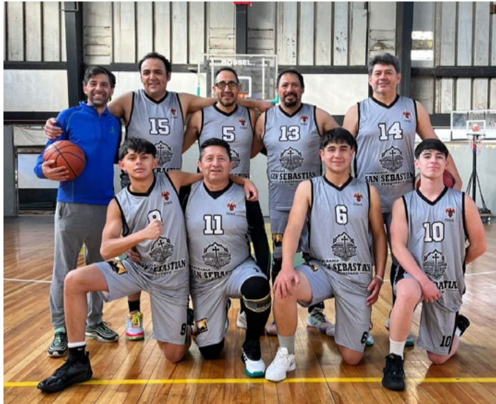
C.D. Empleados Públicos.

-En el citado certamen se consideran además entregar espacios al básquetbol formativo y competitivo como preliminares, tanto en damas como en varones.