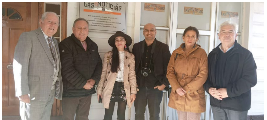
Delegación proyecto revista LOS PINOS.

“Nuestra edición naturalmente quiere resaltar la labor de Las Noticias de Malleco y el apoyo que siempre le ha prestado a la actividad normalista, pero muy en