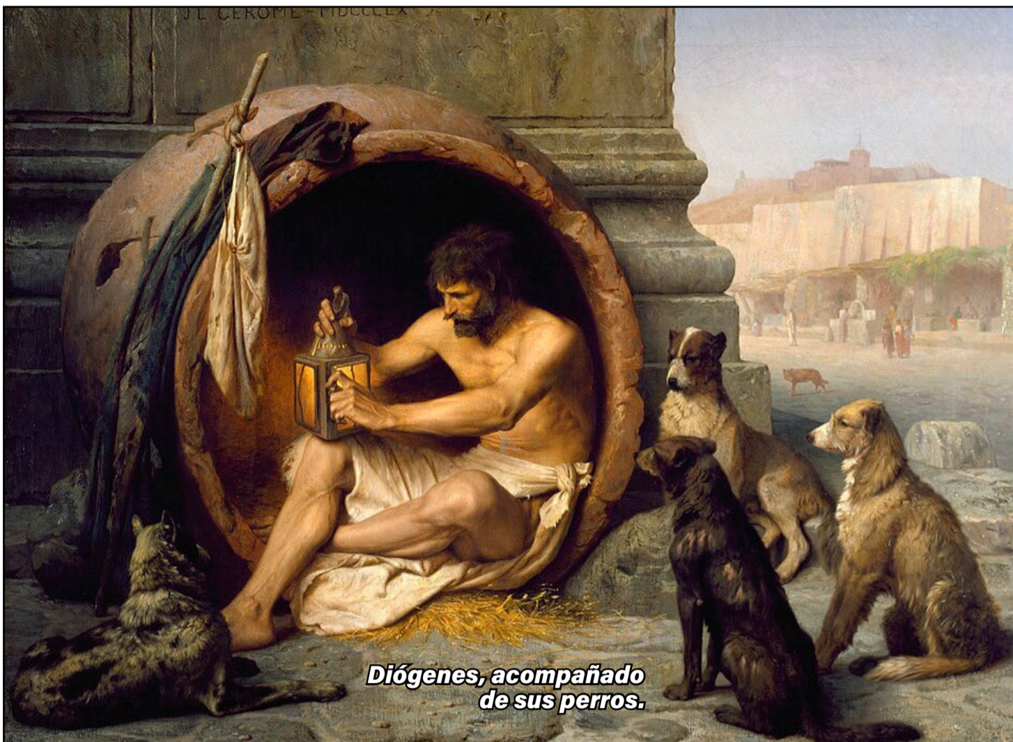
Diógenes, acompañado de sus perros.

Baltasar Gracián aporta un buen ejemplo: "si vemos a una oveja, pareciera que las hemos visto a todas. Si vemos un león, nos quedamos con la sensación que los hemos visto a todos. Pero visto un hombre, solo