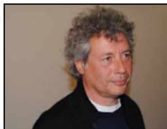
Alessandro Baricco cuestionó crudamente el rol del escritor. Fue exagerado, pero no todo lo señalado estuvo fuera de la realidad.

En verdad, dicho comportamiento es más bien sintomático de que en esa creencia absolutista las cosas no van siempre bien. Es una cuestión de amor propio: el lector se