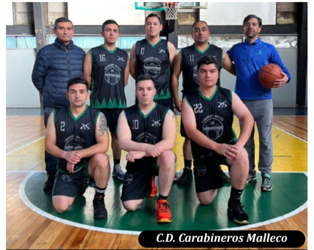
C.D. Carabineros Malleco