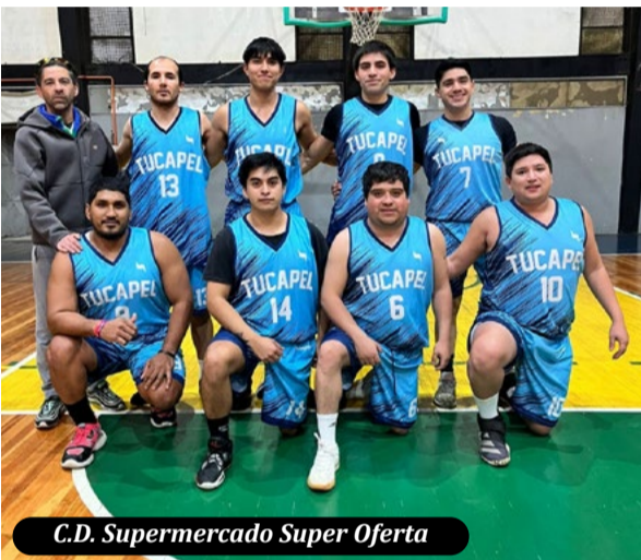
C.D. Supermercado Super Oferta

Viento en popa continúa el Campeonato de Básquetbol Adulto Varones y que se juega todos los Viernes en el rectángulo del Gimnasio Bernardo Muñoz Vargas. Bastante público se ha dado cita a nuestro primer campo deportivo techado para disfrutar de un buen espectáculo cesterero, teniendo en consideración también que pese a citar el nivel adulto, son muchos los jovencitos que integran las plantillas de los diferentes clubes participantes y que han tenido un sobresaliente