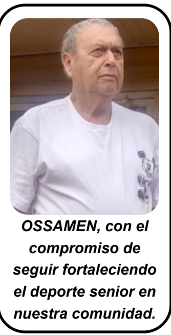
OSSAMEN, con el compromiso de seguir fortaleciendo el deporte senior en nuestra comunidad.