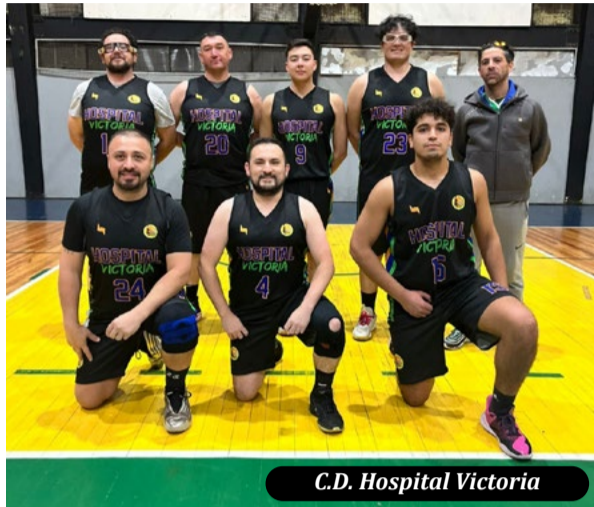
C.D. Hospital Victoria