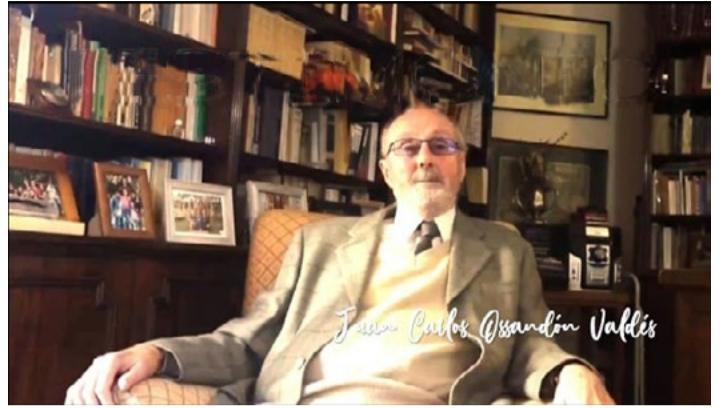
Ética a Nicómaco.

-Kierkegaard señala que no estamos obligados a vivir de acuerdo con los dictados de la moral. La moral es una de las opciones que nos plantea la vida, pero no es la única ni la más atractiva. ¿Cómo le llega esta frase?