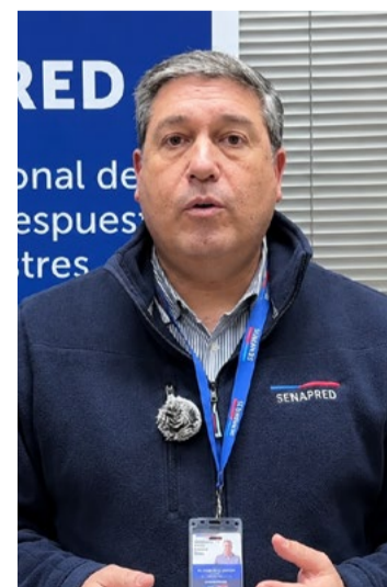
Ian Gorayeb, director regional de Senapred.

En caso de emergencias, Senapred recordó la importancia de informar oportunamente la situación a los equipos municipales o a Bomberos para facilitar una respuesta rápida ante eventuales contingencias.