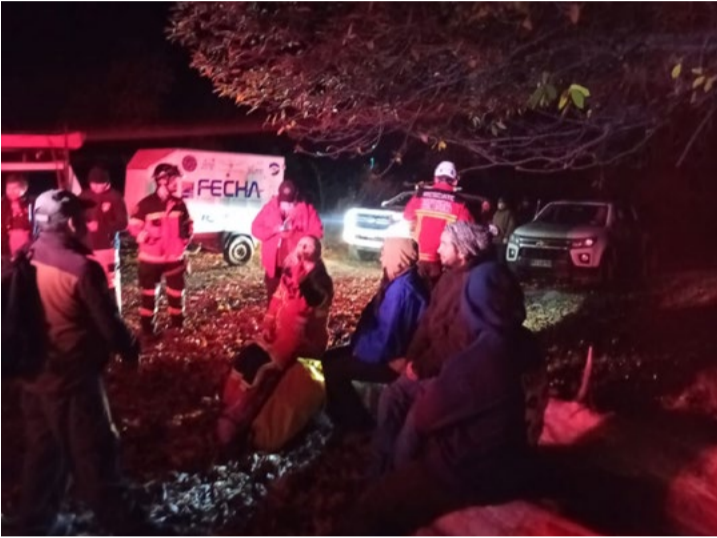
Neimar Claret Andrade

Bomberos, Carabineros y personal municipal participaron en el operativo desarrollado en el sector cordillerano de Pemehue.