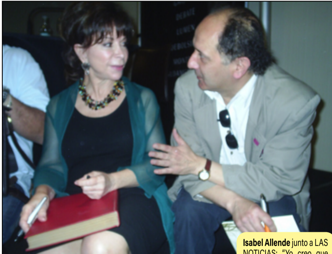
Isabel Allende junto a LAS NOTICIAS: "Yo creo que escribo no solo para recordar, sino para entender".

Allende tenía razón, y se quedaba corta en sus apreciaciones.