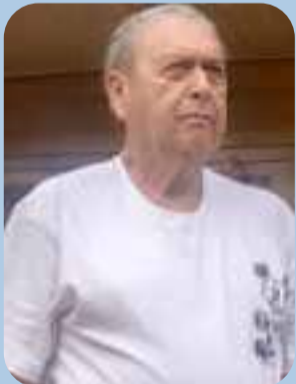
OSSAMEN, con el compromiso de seguir fortaleciendo el deporte senior en nuestra comunidad.

La liga de Fútbol Seniors continúa consolidándose como un espacio de encuentro comunitario, donde equipos tradicionales de la ciudad mantienen viva la pasión por el deporte y la camaradería entre generaciones