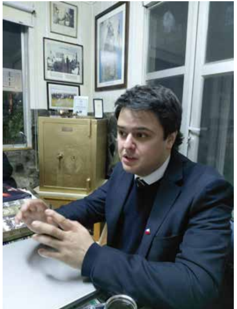
Diputado Eduardo Crettón Rebolledo de visita en Las Noticias de Malleco.

No obstante, también manifestó su preocupación por la relación entre el Gobierno Regional y el Ejecutivo. En ese sentido, cuestionó que el gobernador de La Araucanía no haya sostenido reuniones con el Presidente de la República durante sus visitas a la región, afirmando que, más allá de las diferencias políticas, el diálogo institucional