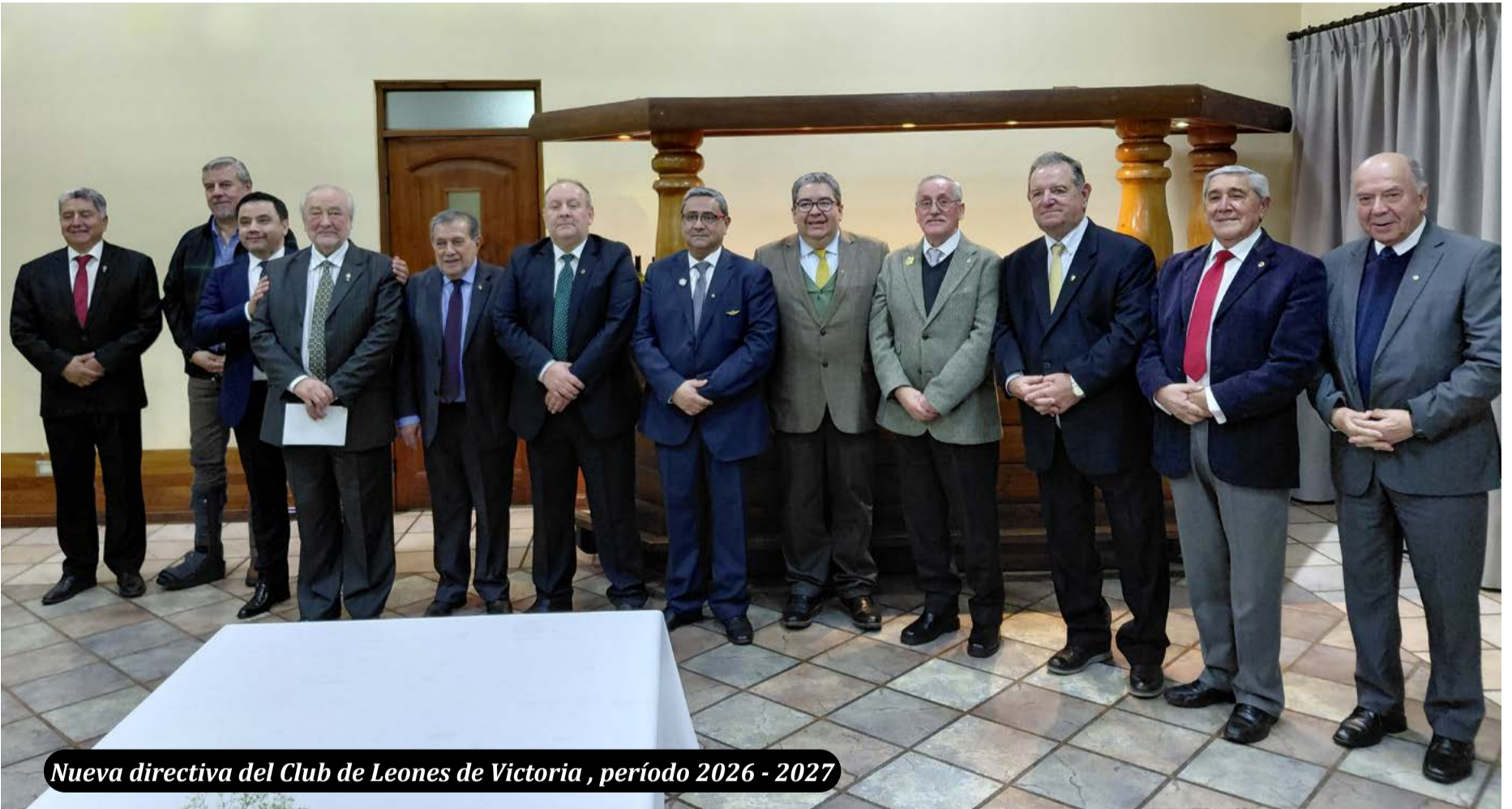
Nueva directiva del Club de Leones de Victoria , período 2026 - 2027

El pasado fin de semana en los salones del Club Social Mariluán se efectuó la ceremonia del cambio de mando del Club de Leones de Victoria, entidad que congrega a 22 socios y paralelo a ello funciona el Comité de Damas.-