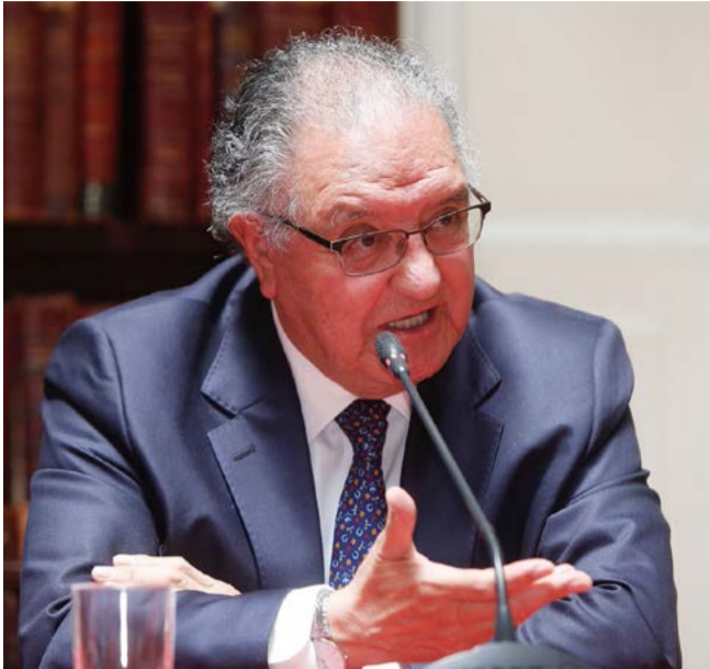
Francisco Huenchumilla Jaramillo, Senador

De ser el “granero de Chile” entre fines del siglo XIX y gran parte del siglo XX, a ser una zona donde casi el 70% de la actividad corresponde al sector de servicios. Ese es el viaje económico que ha tenido nuestra región de La Araucanía; un territorio de grandes contrastes, donde el rezago económico estructural en sectores que alguna vez fueron gravitantes para el desarrollo local, como la agricultura –sumado a otros factores, como una falta crónica de inversión y empleo en zonas urbanas y rurales– influyen hasta hoy en liderar un triste ranking: seguimos siendo la región más pobre del país.